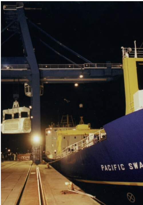
Cargando un embalaje de desecho vitrificado a un buque de PNTL

Los embarques marítimos de desecho vitrificado de alto nivel son una parte importante de la infraestructura para proveer de energía nuclear limpia y segura a nuestro mundo moderno. A su vez, las plantas de energía nuclear incrementan la contribución a los esfuerzos globales para reducir las emisiones que pueden estar afectando el clima mundial.